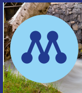
40. Isabelle Vramsten