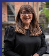
19. Hacer Ok