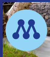
30. Fatima Rodin