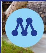
40. Isabelle Vramsten