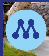
30. Fatima Rodin