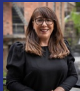
19. Hacer Ok